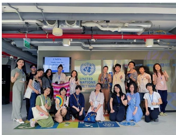
Chuyến tham quan học tập kinh nghiệm giữa nhóm LGBTIQ+ trẻ về quá trình thúc đẩy bình đẳng giới ở Việt Nam năm 2023.

Liên quan đến các thảo luận về luật pháp và quyền của người LGBTIQ+, các hội thảo về chủ đề này xuất hiện tại không gian này từ năm 2016, cụ thể là trong buổi trò chuyện giữa đại diện từ Đại sứ quán Australia và các tổ chức cộng đồng ở Việt Nam tại Đại sứ quán Australia để ghi nhận các tiến bộ của Việt Nam trong việc bảo vệ quyền của người LGBTIQ và các lĩnh vực cộng đồng đang mong được tiếp tục cải thiện. Tại thời điểm này, những thảo luận về chủ đề quyền và sự hiện diện của người queer đã mở rộng hơn, nhận được sự quan tâm từ quốc tế.