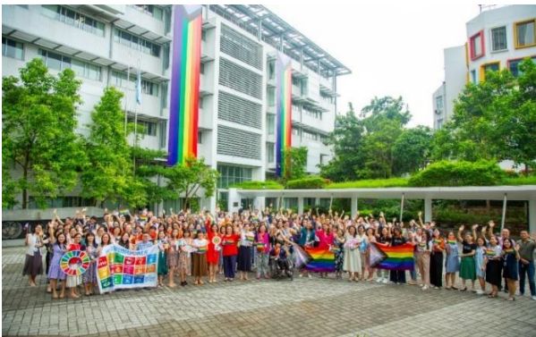
Nhân viên của Liên Hợp Quốc tại Việt Nam tụ họp ở Tòa nhà Xanh Liên Hợp Quốc để hưởng ứng Hanoi Pride 2022.