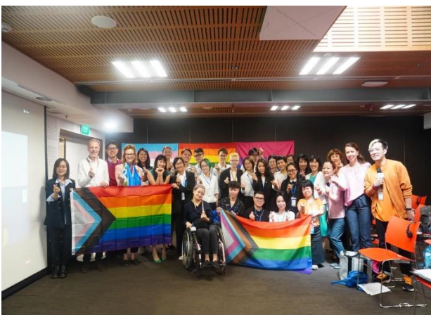
Cuộc gặp mặt cộng đồng và tham vấn về “Bộ chỉ số Hòa nhập LGBTI” tại Tòa nhà Xanh Liên Hợp Quốc năm 2022.

Pride, và nhóm cộng đồng LGBTIQ+ tại Hà Nội. Hoạt động này đã đem đến cơ hội giao lưu và chia sẻ kinh nghiệm giữa những tổ chức, nhóm cộng đồng hoạt động vì quyền của người LGBTIQ+ ở Việt Nam và quốc tế. 2 sự kiện còn lại là các cuộc gặp mặt với nhóm cộng đồng LGBTIQ+ tại Tòa nhà Xanh Liên Hợp Quốc nhằm tham vấn về “Bộ chỉ số Hòa nhập LGBTI” (LGBTI Inclusion Index) và trao đổi kinh nghiệm thúc đẩy bình đẳng giới tại Việt Nam. Những hoạt động trên do UNDP phối hợp tổ chức cùng các cơ quan đại diện ngoại giao và NGO (Viện ISEE, CSAGA, UNICEF), hướng đến xây dựng năng lực cho cán bộ chương trình và nhà hoạt động về quyền LGBTIQ+ trẻ.