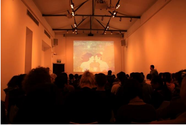
Khai mạc liên hoan nghệ thuật “Queer Forever!” 2015 tại Viện Goethe.