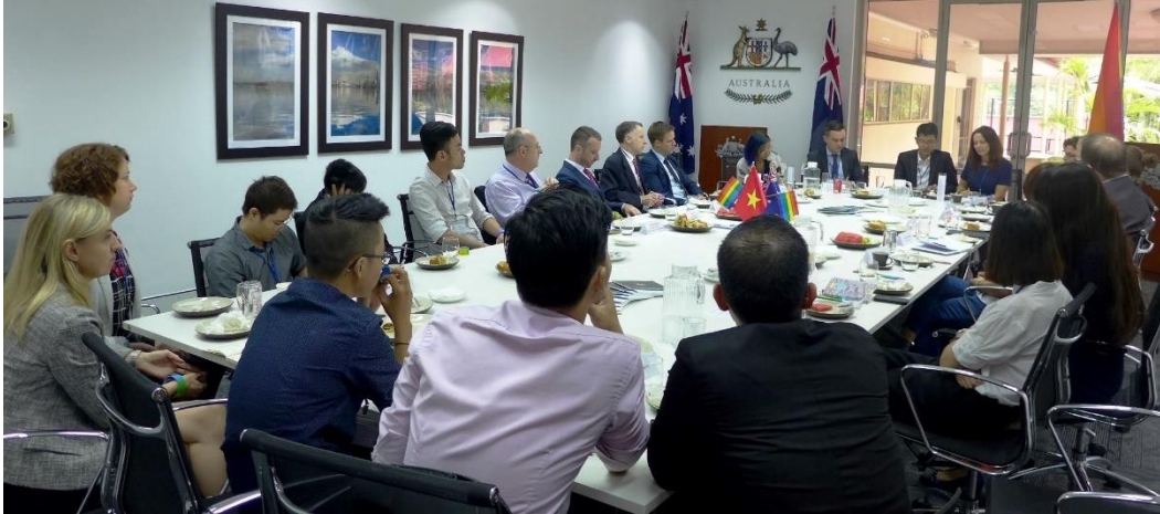
Bữa trưa thân mật giữa các đại diện ĐSQ Australia với các nhóm cộng đồng LGBTIQ năm 2016.

Đến năm 2022, tại “Hội thảo tham vấn về Kết quả sơ bộ của Bộ chỉ số Hòa nhập LGBTI”, các đại diện từ cơ quan đại diện ngoại giao, tổ chức và nhóm cộng đồng đã chia sẻ và thảo luận sôi nổi về những kết quả đạt được sau nhiều năm truyền thông xã hội và vận động quyền. Việt Nam trở thành quốc gia Đông Nam Á duy nhất, và là một trong hai quốc gia tại Châu Á tham gia vào giai đoạn thí điểm của bộ chỉ số này.