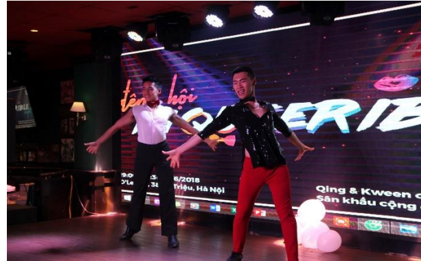
“Inqueerable Night” là sự kiện prom dành riêng cho cộng đồng LGBTQ+ tại O’Learys Bar năm 2018.

Các sự kiện có tính xây dựng cộng đồng tổ chức tại các cơ sở kinh doanh dịch vụ thường là những hoạt động gặp mặt, tập huấn, hội thảo, tọa đàm nhằm (i) nâng cao kiến thức và năng lực, (ii) nêu lên thách thức và đề ra định hướng hoạt động, (iii) kết nối các cá nhân, nhóm, tổ chức hoạt động vì quyền của người LGBTQ+. Các sự kiện này thường được tổ chức ở phòng họp, phòng hội nghị của khách sạn và văn phòng co-working của các nhóm, tổ chức cộng đồng như Queer Hub (Hà Nội Queer), iSEE Hub (Viện iSEE) hay CEPEW Nest (CEPEW).