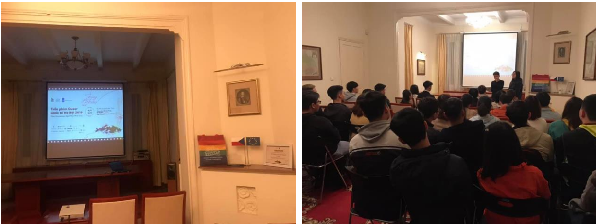
Buổi chiếu phim thuộc “Tuần phim Queer Quốc tế Hà Nội” năm 2019 tại Đại sứ quán Cộng hòa Séc ở Hà Nội.

phim đã đem đến cho khán giả 34 bộ phim queer độc lập đến từ 20 quốc gia và vùng lãnh thổ trên thế giới.