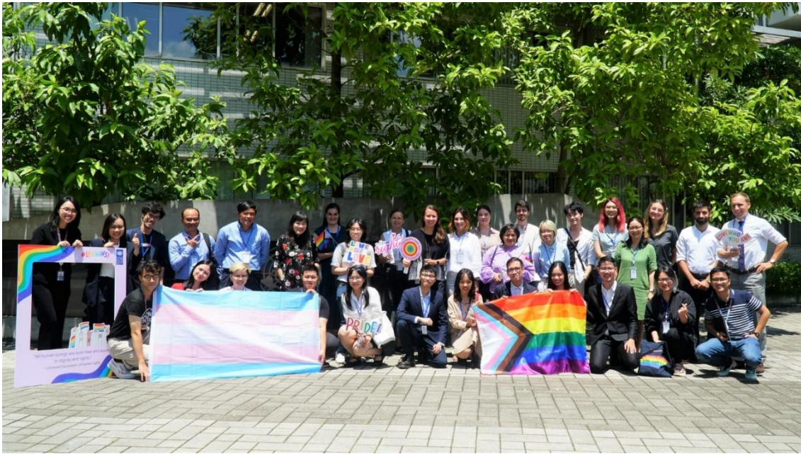
Hội thảo tham vấn về kết quả sơ bộ của “Bộ chỉ số Hòa nhập LGBTI” tại Việt Nam năm 2022.

Đến năm 2022, tại “Hội thảo tham vấn về Kết quả sơ bộ của Bộ chỉ số Hòa nhập LGBTI”, các đại diện từ cơ quan đại diện ngoại giao, tổ chức và nhóm cộng đồng đã chia sẻ và thảo luận sôi nổi về những kết quả đạt được sau nhiều năm truyền thông xã hội và vận động quyền. Việt Nam trở thành quốc gia Đông Nam Á duy nhất, và là một trong hai quốc gia tại Châu Á tham gia vào giai đoạn thí điểm của bộ chỉ số này.