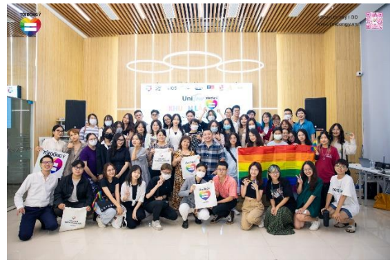
2022 Tôi đồng ý - UNI Tour Swinburn

Bên cạnh đó, các sự kiện tại các không gian giáo dục được tổ chức nhiều tại không gian các trường đại học từ đại học công lập như ĐH Bách Khoa Hà Nội, ĐH Khoa học xã hội và Nhân văn, ĐH Kinh tế quốc dân; đại học tư nhân như Vin University đến các trường quốc tế như BUV, RMIT (chiếm 95.08%) và ít hơn tại các trường trung học phổ thông, cụ thể là THPT Việt Đức, THPT Vân Nội và THPT Olympia (chiếm 4.92%).