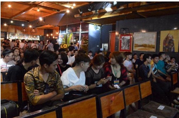
Sự kiện “Out and Proud Summer Party” được tổ chức để hưởng ứng Tháng Tự hào và nâng cao nhận thức về an toàn tình dục và HIV cho cộng đồng tại LaCa Cafe năm 2018.