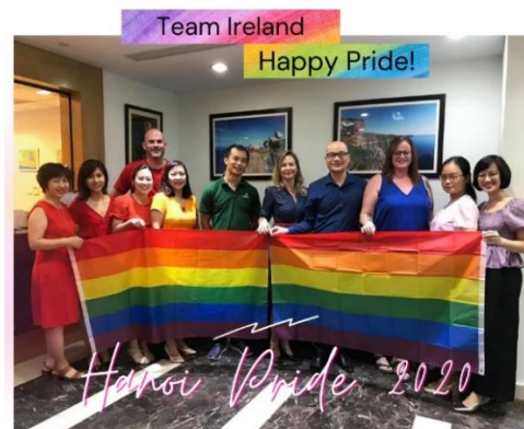
Cán bộ, nhân viên tại Đại sứ quán Ireland hưởng ứng Hanoi Pride 2020.