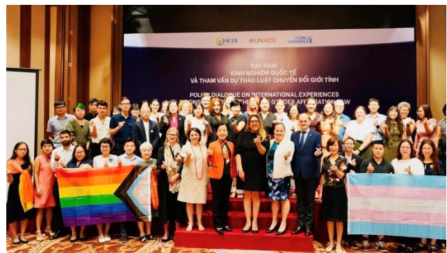
Tọa đàm “Kinh nghiệm quốc tế và tham vấn dự thảo luật chuyển đổi giới tính” tại Khách sạn Đối ngoại Hà Nội, năm 2022.