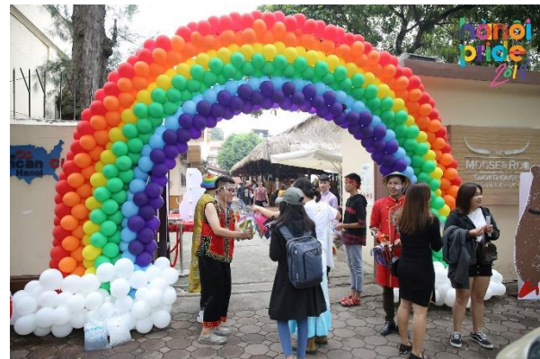
American Club là địa điểm gắn liền với sự kiện thường niên lớn nhất của cộng đồng LGBTIQ+ Hà Nội - Hanoi Pride.