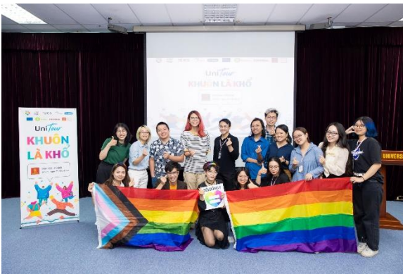
2022 Tôi đồng ý – UNI Tour ĐH Hà Nội

Một xã hội tồn tại nhiều khuôn mẫu chưa bao giờ là một môi trường lý tưởng để bộc lộ và phát triển tài năng ở mức tốt nhất của mỗi người. Khuôn mẫu giới có thể sẽ khiến nhiều người bỏ qua những cơ hội tốt và phù hợp trong cuộc sống của họ, buộc họ phải đi trên con đường không hoàn toàn đúng với đam mê cũng như thực lực của mình. Ví dụ như việc một bạn nam có ước mơ được học nghề nấu ăn làm bánh...”