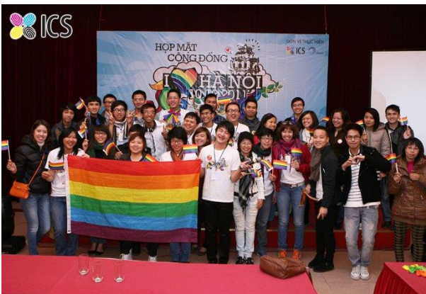
Buổi họp mặt cộng đồng LGBTQ+ “I Heart Hà Nội” do iSEE và ICS tổ chức tại Nhà khách Quân đội năm 2011.

Các sự kiện có tính xây dựng cộng đồng tổ chức tại các cơ sở kinh doanh dịch vụ thường là những hoạt động gặp mặt, tập huấn, hội thảo, tọa đàm nhằm (i) nâng cao kiến thức và năng lực, (ii) nêu lên thách thức và đề ra định hướng hoạt động, (iii) kết nối các cá nhân, nhóm, tổ chức hoạt động vì quyền của người LGBTQ+. Các sự kiện này thường được tổ chức ở phòng họp, phòng hội nghị của khách sạn và văn phòng co-working của các nhóm, tổ chức cộng đồng như Queer Hub (Hà Nội Queer), iSEE Hub (Viện iSEE) hay CEPEW Nest (CEPEW).