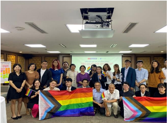
Diễn đàn “Hợp lực và hành động nâng cao sức khỏe tinh thần cho cộng đồng LGBTQ+ tại Việt Nam” tại Sen Grand Hotel and Spa, năm 2022.