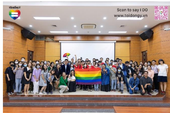
2022 Tôi đồng ý – UNI Tour ĐH Y