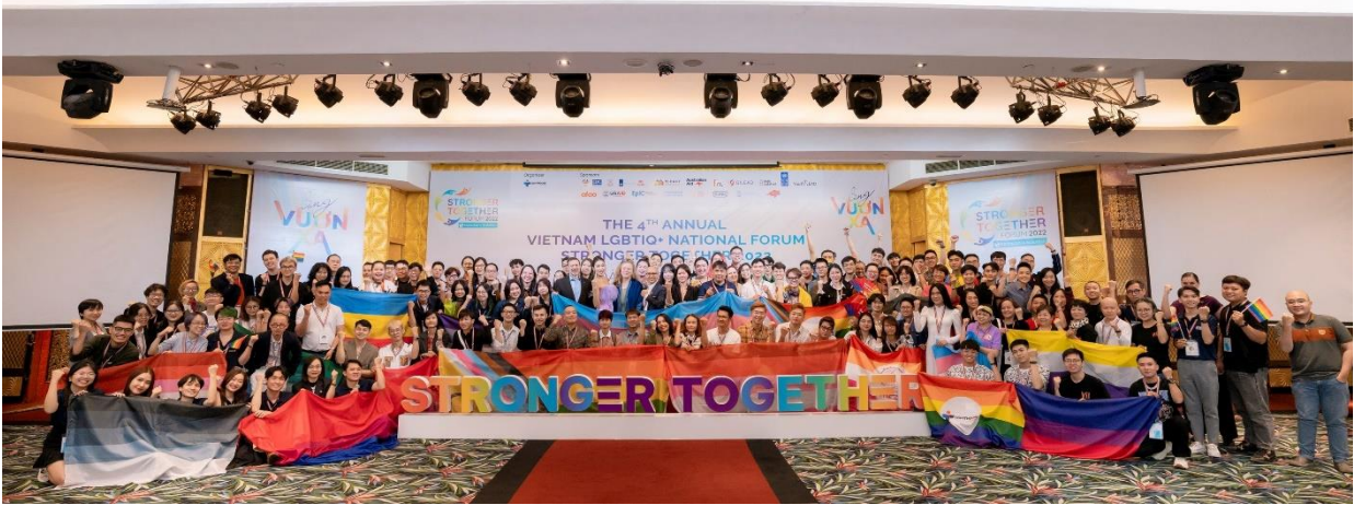
Diễn đàn “Cùng Vươn xa – Stronger Together Summit” là sự kiện thường niên dành cho các tổ chức, nhóm cộng đồng để thảo luận về những thách thức và giải pháp thúc đẩy quyền của người LGBTQ+ tại Khách sạn Fortuna năm 2022.

Liên quan đến chủ đề sức khỏe , từ năm 2016, các buổi chia sẻ và workshop xoay quanh các vấn đề sức khỏe thể chất, tâm lý, tình dục của người chuyển giới (phẫu thuật chuyển đổi giới tính, sử dụng hormone, trở ngại tâm lý...) bắt đầu được các nhóm, tổ chức cộng đồng thực hiện tại các quán cà phê và không gian co-working thân thiện với cộng đồng LGBTQ+. Ở quy mô lớn hơn, những buổi tọa đàm, hội thảo liên quan đến vấn đề sức khỏe cho người LGBTQ+ lại diễn ra ở phòng hội thảo của khách sạn và văn phòng co-working của các tổ chức cộng đồng, ví dụ như buổi “Giao lưu với các bác sỹ từ Hiệp hội Chuyên khoa thể giới về Sức khỏe Chuyển giới (WPATH)” (iSEE Hub, 2020) và diễn đàn “Hợp lực và hành động nâng cao sức khỏe tinh thần cho cộng đồng LGBTQ+ tại Việt Nam” (Sen Grand Hotel and Spa, 2022).