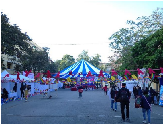
STEP UP - Bắt sóng cảm xúc, Tận hưởng yêu thương tại ĐH Kinh tế quốc dân năm 2019