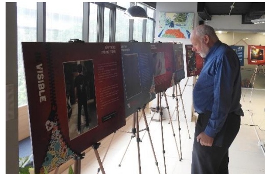
Triển lãm Photovoice INVISIBLE - Bên trong khoảng trống tại The Mahogany Core Space năm 2018