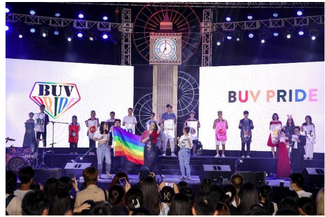
Sự kiện Meet & Mingle 2022 tại British University Vietnam

Chỉ có 2 sự kiện liên quan đến Luật được tổ chức tại không gian giáo dục mà nhóm khảo sát tìm kiếm được thông tin. Cụ thể là Tọa đàm Người chuyển giới trong Bộ Luật Dân sự sửa đổi năm 2015 tổ chức tại Đại học Công đoàn năm 2015 và Hội thảo “Pháp luật về chuyển đổi giới tính trên thế giới và kinh nghiệm cho Việt Nam” tại Khoa Luật Đại học Quốc gia năm 2016. Những năm về sau, nhóm khảo sát không tìm thấy thông tin các sự kiện liên quan đến luật hay quyền cho người LGBTIQ+ khác được tổ chức tại các không gian giáo dục.