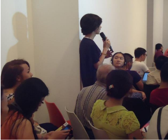
Hội thảo “Trình bày Báo cáo Quốc gia về LGBT năm 2013 của Liên Hợp Quốc” tại Viện Goethe năm 2014 (ảnh: Hanoi Pride).