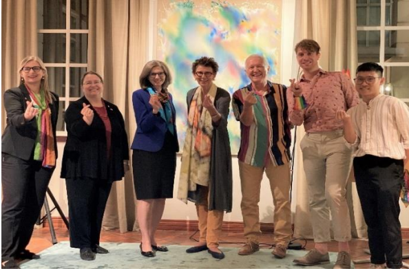
Lễ khai mạc “Hanoi Pride 2021: Hành trình 10 năm tự hào tại Nhà riêng đại sứ Na Uy