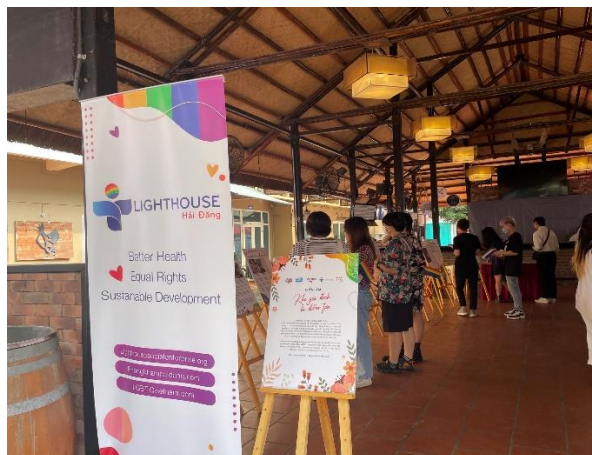
Triển lãm ảnh “Khi gia đình là điểm tựa” diễn ra tại American Club năm 2022.

Về mục đích, các sự kiện liên quan tới LGBTIQ+ được tổ chức tại trung tâm trao đổi, giao lưu văn hóa thường tập trung vào (1) truyền thông, nâng cao nhận thức (chiếm 75.56%); giải trí (chiếm 13.33%); thảo luận về quyền và pháp lý (chiếm 4.44%) và (4) hoạt động sinh kế (chiếm 2.22%).