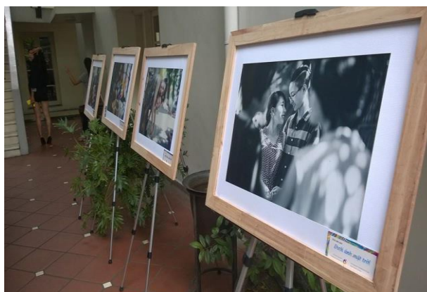
Triển lãm ảnh “Dưới ánh mặt trời” tổ chức tại Viện Goethe năm 2014 (ảnh: 6+).