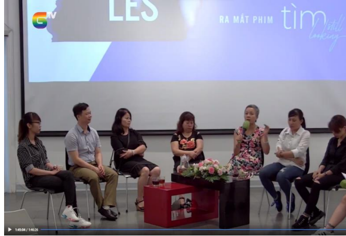
Tọa đàm “Gay lấy Les có phải giải pháp hoàn hảo?” do CSAGA diễn ra tại Viện Goethe năm 2019.

Chỉ có 1 hoạt động liên quan đến vấn đề sinh kế của người queer diễn ra tại trung tâm trao đổi, giao lưu văn hóa. Đó là “Hội thảo về Kỹ năng lãnh đạo và kinh doanh dành cho thành viên cộng đồng LGBTI”, được tổ chức bởi American Center năm 2016. Sự kiện nhằm truyền cảm hứng và mở ra những cơ hội thay đổi cuộc sống của người queer.