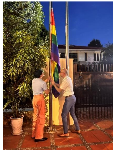
Đại sứ Canada treo cờ lục sắc nhân chuỗi sự kiện Hanoi Pride 2023

Đối với mục đích giải trí, các sự kiện thường được tổ chức dưới hình thức chiếu phim miễn phí, đem tới cho khán giả nhiều lứa tuổi và giới tính những tác phẩm về đề tài LGBTIQ đến từ các quốc gia khu vực Đông Nam Á, Đông Á, và châu Âu. Điển hình là sự kiện “Chiếu phim điện ảnh và phim tài liệu về queer” do Trung tâm hỗ trợ cộng đồng Hải Đăng, nhóm cộng đồng LumiQueer và Document Our History Now (DOHN) tổ chức năm 2022 tại nhà riêng của Đại sứ Hà Lan.