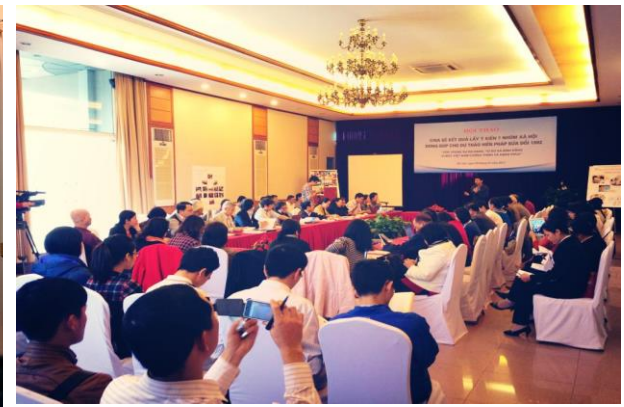
Lần đầu cộng đồng LGBT và 6 nhóm xã hội khác tham gia góp ý về quyền con người. Hơn 2000 ý kiến đã được tổng hợp và gửi trực tiếp tới đại biểu Quốc hội. Địa điểm: Nhà khách Quân đội, năm 2013.