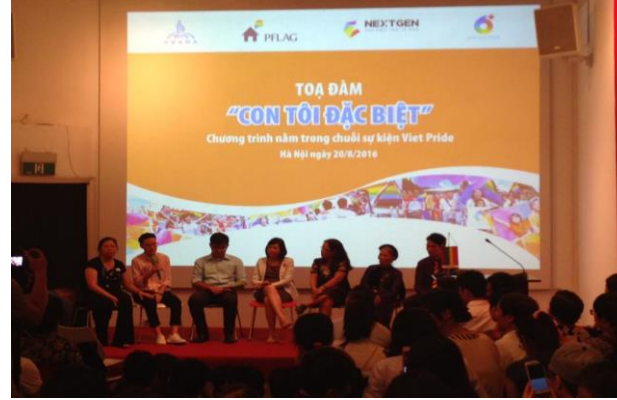
Tọa đàm “Con tôi đặc biệt” do CSAGA, PFLAG, NextGen và 6+ tổ chức tại Viện Goethe năm 2016 (ảnh: 6+).

Các lễ hội thường niên quy mô lớn như ASEAN Pride (2013, 2014), đêm hội Tuần lễ Tự hào (Viet Pride – Hanoi Pride), hay Thị trấn BUBU (BUBU Town, 2015-2018) lại thường được tổ chức ở American Club nhờ lợi thế là không gian mở. Những sự kiện như trên luôn thu hút đông đảo người tham gia ở mọi lứa tuổi, giới tính; có nhiều hoạt động thú vị như gian hàng, trò chơi, nhạc hội; do đó trở thành không gian an toàn để người queer hiện diện và để truyền tải thông điệp tôn trọng sự đa dạng tới cộng đồng. Bên cạnh đó, Trung tâm Hoa Kỳ (American Center) và Trung tâm Văn hóa Pháp (L’Espace) cũng là những không gian diễn ra các buổi nói chuyện, chia sẻ về chủ đề LGBTIQ+, ví dụ như buổi chiếu phim – thảo luận “Giới, bản dạng và quyền LGBT” (Trung tâm Văn hóa Pháp, 2018) hay thảo luận “Queer Hanoi, 1990-2020: Reflections on Emerging Identities” (Trung tâm Hoa Kỳ, 2020).