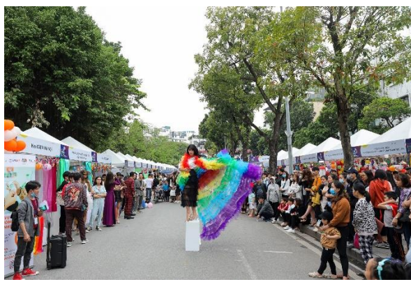
BridgeFest năm 2020 tại Phố đi bộ Hồ Gươm