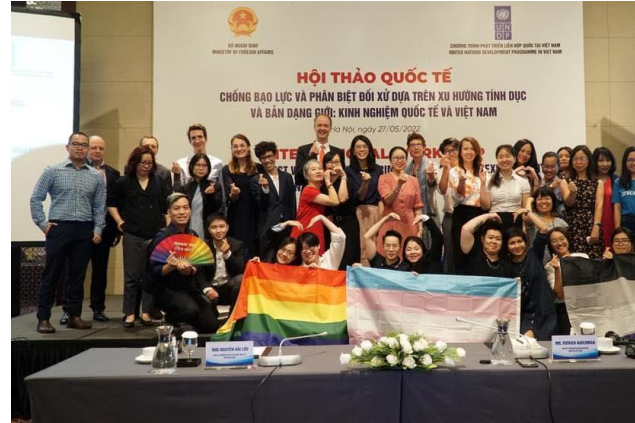
Hội thảo “Chống bạo lực và phân biệt đối xử dựa trên xu hướng tính dục và bản dạng giới: Kinh nghiệm quốc tế và Việt Nam tại Khách sạn Intercontinental năm 2022.

Đối với mục đích giải trí, các sự kiện diễn ra ở không gian dịch vụ thường được tổ chức với nhiều hình thức như gặp mặt nhóm cộng đồng, ca nhạc, dạ hội, và biểu diễn drag. Không gian này bắt đầu được các nhóm cộng đồng chọn làm nơi tổ chức sự kiện từ năm 2013 và trở nên rất phổ biến từ 7 năm gần đây. Đa số hoạt động đều diễn ra tại các quán cà phê và bar/club/lounge, tạo ra không gian an toàn, cởi mở để người queer gặp gỡ, giao lưu. Điển hình có thể kể đến là sự kiện “6’MAS Big Party” (KANDY Club, 2013), buổi hẹn