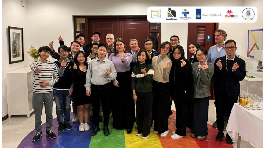
Sự kiện “Chiếu phim điện ảnh và phim tài liệu về queer” tại nhà riêng của Đại sứ Hà Lan năm 2022 (ảnh: Trung tâm hỗ trợ cộng đồng Hải Đăng).

Chỉ có một sự kiện tổ chức tại Nhà riêng Đại sứ mang tính xây dựng cộng đồng. Đó là buổi chia sẻ về những nỗ lực thúc đẩy quyền cho cộng đồng LGBTIQ+ ở Việt Nam, đặc biệt là người chuyển giới, mang tên “Nhật thực” tại nhà riêng của Đại sứ Canada. Sự kiện thuộc khuôn khổ Tuần lễ Tự hào Hanoi Pride 2023, với sự tham gia của các đối tác thuộc nhóm G4 (Canada, New Zealand, Na Uy, Thụy Sĩ) và các thành viên trong cộng đồng LGBTIQ+ ở Hà Nội.