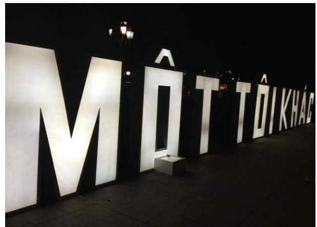
Triển lãm “Một tôi khác” tại Vườn hoa Lý Thái Tổ năm 2013

Giai đoạn gần đây từ 2016-2023, trung bình mỗi năm chỉ có 2 sự kiện diễn ra tại các không gian mở ngoài trời, chủ yếu là phố đi bộ hồ Gươm và nổi bật là VietPride được tổ chức định kỳ vào tháng 8 hàng năm.