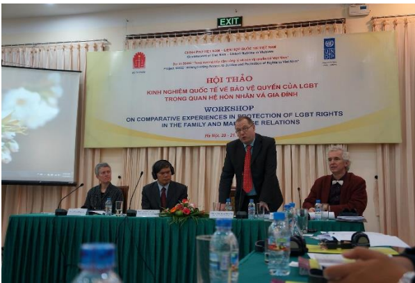
Hội thảo đầu tiên của Bộ Tư pháp tìm hiểu về hôn nhân đồng giới tại Nhà khách Hồ Tây, năm 2012 (ảnh: ICS).