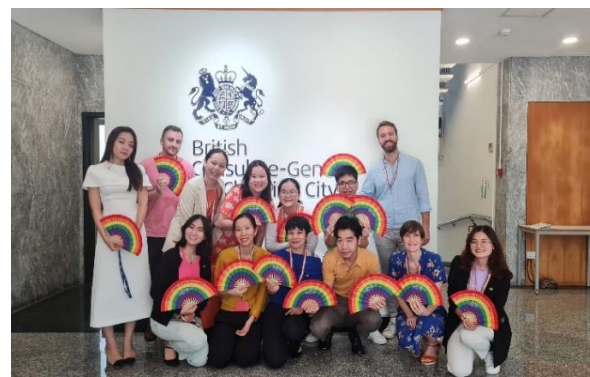
Các cán bộ ĐSQ Anh và Tổng lãnh sự quán Anh tại Hà Nội hưởng ứng Tháng Tự hào năm 2023.

Các hoạt động mang tính xây dựng cộng đồng thường là các buổi gặp mặt thân mật giữa các cơ quan đại diện ngoại giao và các tổ chức cộng đồng. Ví dụ, trong khuôn khổ Tuần lễ Tự hào (Hanoi Pride) 2019, Đại sứ quán Na Uy từng tổ chức buổi gặp mặt thân mật với đại diện đại sứ quán các nước, ban tổ chức Hanoi