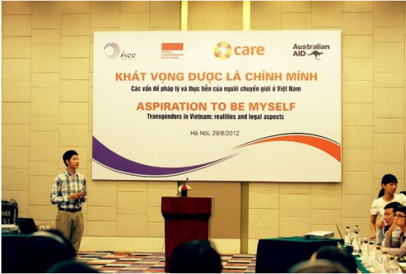
Hội thảo “Khát vọng được là chính mình” trình bày nghiên cứu đầu tiên về người chuyển giới tại Việt Nam - khách sạn Pullman, năm 2012.