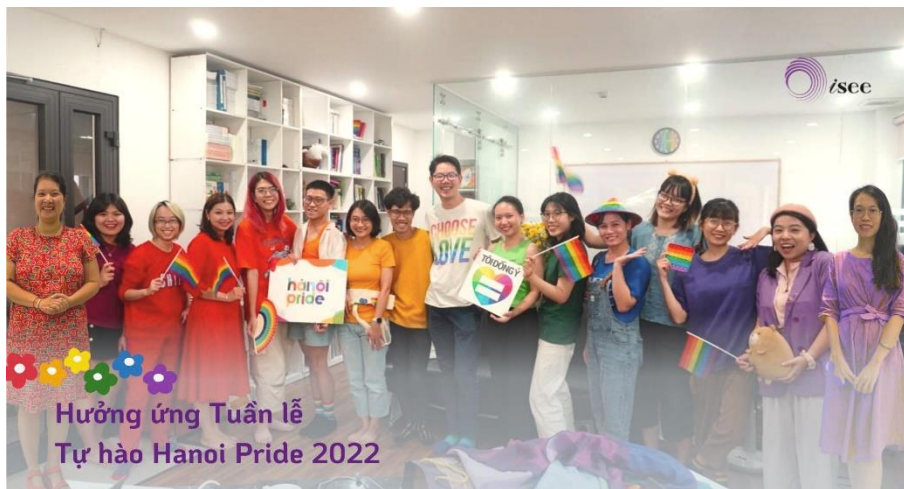
Viện iSEE hưởng ứng tuần lễ tự hào Hanoi Pride 2022