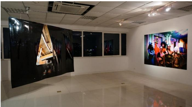
Triển lãm "heARTbreak!" tại Nhà sàn Collective năm 2015