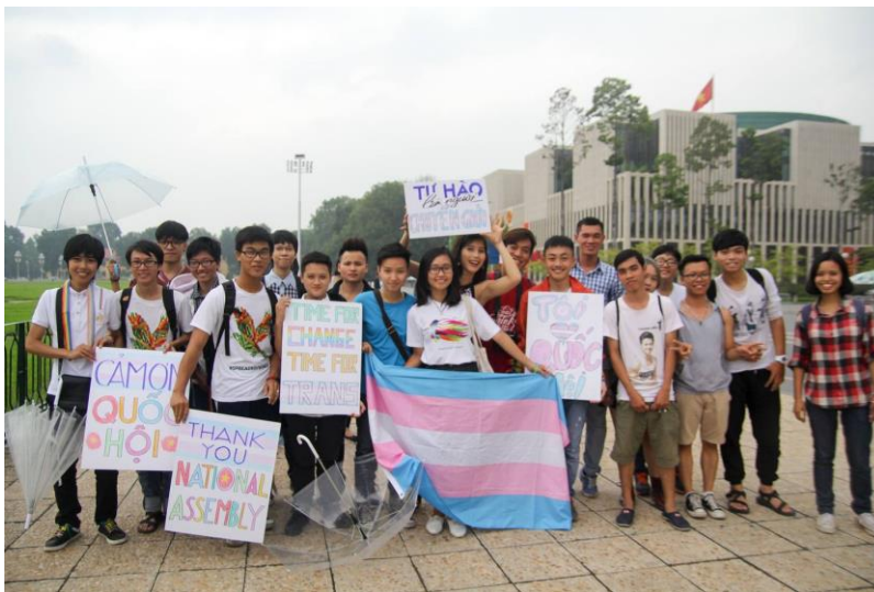
Sự kiện “Cảm ơn Quốc hội” trước Tòa nhà Quốc hội năm 2015

Theo kế hoạch, Giang và mọi người đi bến xe bus đối diện công viên Lenin để chờ đoàn đại biểu đi qua. Khi đoàn đại biểu đi qua, cả nhóm vui mừng giơ các biểu ngữ cảm ơn thể hiện niềm trân trọng với họ. Nhiều đại biểu ngồi trên xe cũng nhìn về phía chúng tôi, có lẽ họ cũng vui mừng khi chứng kiến những người xa lạ cổ vũ hành trình vận động pháp lý của họ."