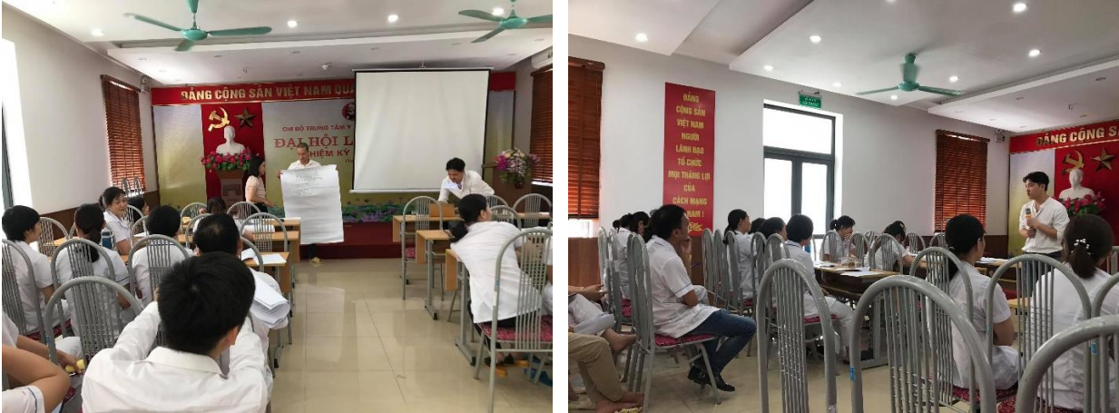
Cán bộ y tế và nhân viên Trung tâm Y tế quận Thanh Xuân tham gia tập huấn “Nâng cao kiến thức và kỹ năng cho nhân viên y tế hướng tới môi trường y tế thân thiện với cộng đồng đích” năm 2020 (ảnh: Trung tâm hỗ trợ cộng đồng Hải Đăng).

thiện với cộng đồng đích” được tổ chức năm 2020 tại Trung tâm Y tế quận Thanh Xuân – đơn vị sự nghiệp công lập trực thuộc Sở Y tế. Sự kiện do Trung tâm hỗ trợ cộng đồng Hải Đăng tổ chức, với sự tham gia của 36 cán bộ y tế và nhân viên làm việc tại Trung tâm Y tế quận Thanh Xuân. Tập huấn nhằm mục đích (i) nâng cao nhận thức của cán bộ, nhân viên y tế về cộng đồng LGBTQ+; (ii) cung cấp kiến thức về đa dạng giới và tính dục, và (iii) thực hành quy tắc ứng xử, tư vấn và cung cấp dịch vụ y tế thân thiện, có chất lượng cho cộng đồng đích.