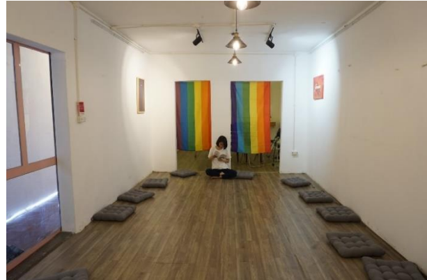
Queer Hub

Ngoài ra, sự phát triển mạnh mẽ của internet và mạng xã hội trong giai đoạn này tạo điều kiện cho các cá nhân, hội nhóm, tổ chức và các cơ quan, đoàn thể chia sẻ thông tin về các sự kiện LGBTQ+ một cách rộng rãi hơn.