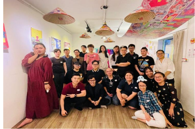
Sự kiện “Hành trang pháp lý 2: Có lực mới vực được quyền” ở Queer Hub năm 2021.