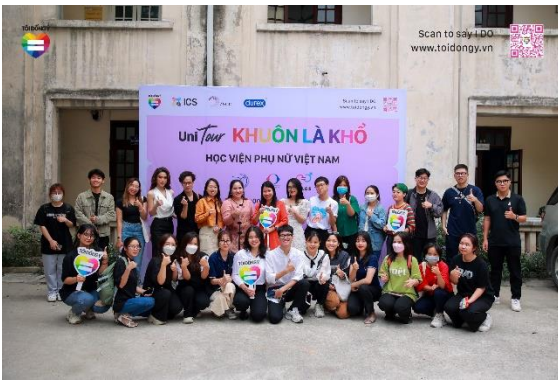
2022 Tôi đồng ý - UNI Tour Học viện PN