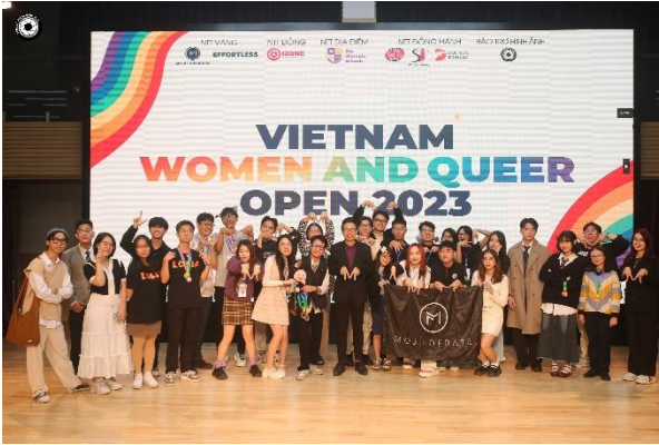
“Vietnam Women and Queer Open” tại Trường Phổ thông Olympia năm 2023