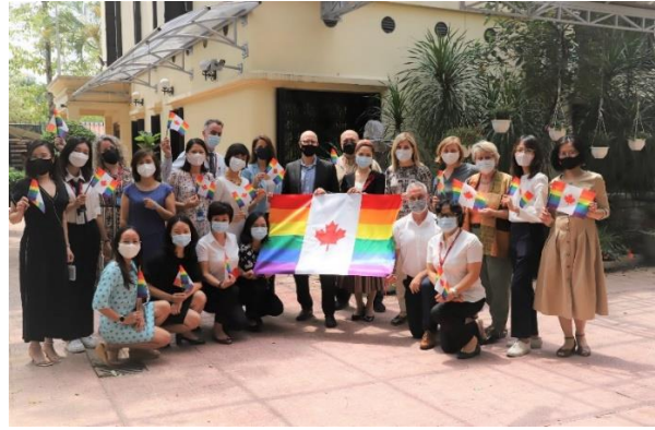
Đại sứ Canada và các cán bộ đại sứ quán treo cờ hưởng ứng ngày IDAHOBIT năm 2022 tại nhà riêng của đại sứ