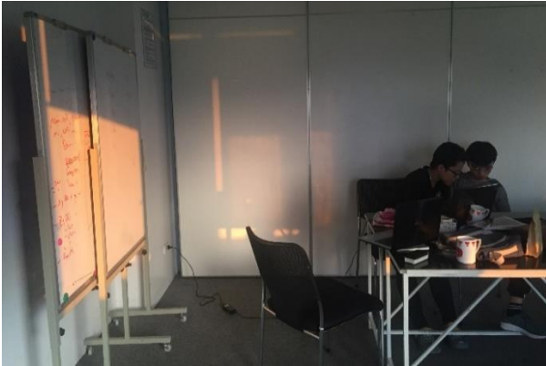
iSEE Hub

gian làm việc chung hỗ trợ cho các hội nhóm LGBTQ hướng tới các cơ hội phối hợp và hợp tác bền vững nữa đó nha!” Hà Nội Queer, 2021