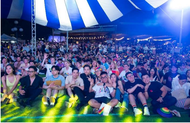
“Đêm hội Tự hào” của Hanoi Pride 2023 tại American Club đã thu hút hàng trăm người queer và người ủng hộ tham gia.