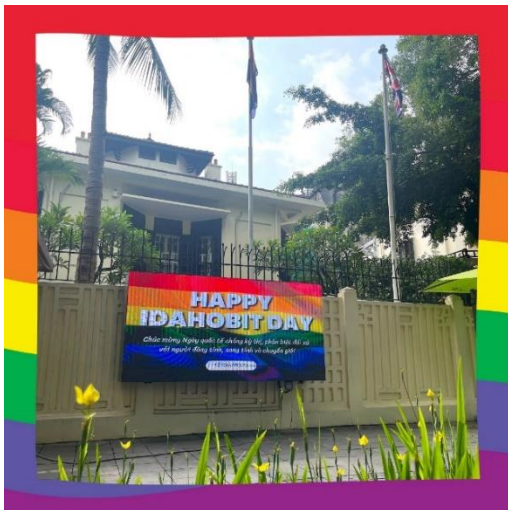
Lá cờ cầu vồng được treo tại nhà riêng của Đại sứ Anh Iain Frew nhân ngày quốc tế IDAHOTBIT 2023