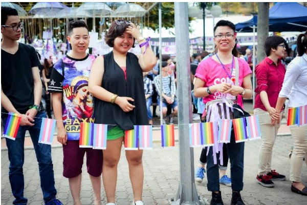
Sự kiện “Thị trấn BUBU” được tổ chức tại American Club năm 2016 (ảnh: iSEE).

Các lễ hội thường niên quy mô lớn như ASEAN Pride (2013, 2014), đêm hội Tuần lễ Tự hào (Viet Pride – Hanoi Pride), hay Thị trấn BUBU (BUBU Town, 2015-2018) lại thường được tổ chức ở American Club nhờ lợi thế là không gian mở. Những sự kiện như trên luôn thu hút đông đảo người tham gia ở mọi lứa tuổi, giới tính; có nhiều hoạt động thú vị như gian hàng, trò chơi, nhạc hội; do đó trở thành không gian an toàn để người queer hiện diện và để truyền tải thông điệp tôn trọng sự đa dạng tới cộng đồng. Bên cạnh đó, Trung tâm Hoa Kỳ (American Center) và Trung tâm Văn hóa Pháp (L’Espace) cũng là những không gian diễn ra các buổi nói chuyện, chia sẻ về chủ đề LGBTIQ+, ví dụ như buổi chiếu phim – thảo luận “Giới, bản dạng và quyền LGBT” (Trung tâm Văn hóa Pháp, 2018) hay thảo luận “Queer Hanoi, 1990-2020: Reflections on Emerging Identities” (Trung tâm Hoa Kỳ, 2020).