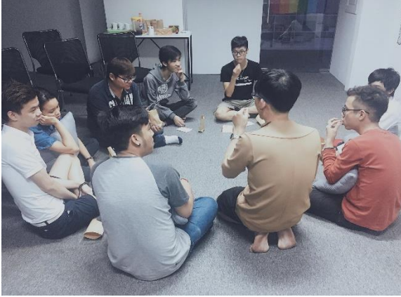
Buổi chiếu phim “QueerCine: A Single Man” diễn ra tại iSEE Hub năm 2017.