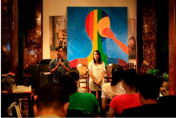
Triển lãm ảnh “Cầu Vồng và Cúc Áo” do Youth Orientation Vietnam tổ chức nhằm phổ biến những hiểu biết đúng đắn và chân thực nhất về cộng đồng LGBT, tại quán café Le Cine năm 2014.