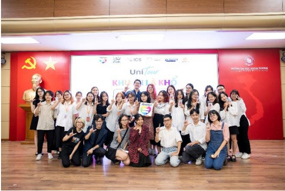
2022 Tôi đồng ý – UNI Tour ĐH Ngoại Thương