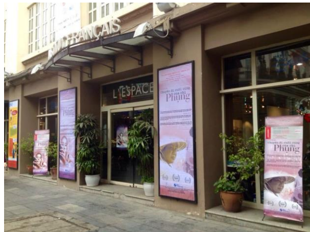
Buổi chiếu phim “Chuyến đi cuối cùng của chị Phụng” tại Trung tâm Văn hóa Pháp năm 2015 (ảnh: Phạm Thị Hồng Ánh).

Liên quan đến các thảo luận về luật/pháp lý, chỉ có 2 hội thảo về luật pháp và quyền của người LGBTIQ+ được tổ chức tại không gian trung tâm trao đổi, giao lưu văn hóa và đều diễn ra tại Viện Goethe. Đó là hội thảo “Trình bày Báo cáo Quốc gia về LGBT năm 2013 của Liên Hợp Quốc” (2014) và tọa đàm giải đáp các vấn đề liên quan đến Luật Hôn nhân Gia Đình cho cộng đồng LGBTIQ+ “Gay lấy Les có phải giải pháp hoàn hảo?” (2019).