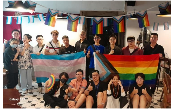
Workshop “Trans Talk 11” mở ra không gian chia sẻ những vấn đề y tế, sức khỏe tình dục cho người chuyển giới tại G.O.K Coffee, năm 2023.

Những sự kiện liên quan đến pháp luật và quyền của cộng đồng LGBTQ+ được tổ chức ở không gian này thường diễn ra trong giai đoạn 2012-2015. Đây là các hội thảo, tọa đàm, tập huấn nhằm vận động quyền của người queer, tập trung vào 2 chủ đề là quyền hôn nhân bình đẳng và dự thảo luật chuyển đổi giới tính.