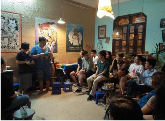
Chuỗi workshop “Vén” tạo không gian chia sẻ giữa những người LGBTQ+ về chủ đề sức khỏe tâm lý, tình dục tại Cafe Nhà Ấm, năm 2017 (ảnh: 6+)