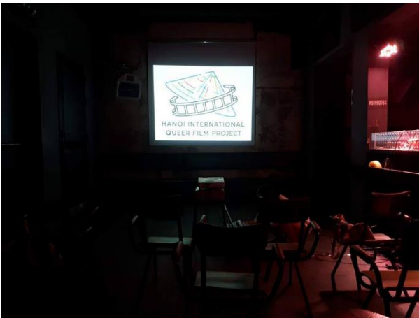
Buổi chiếu phim thuộc “Tuần phim Queer Quốc tế mùa thu” năm 2017 tại Viện Goethe (ảnh: Hanoi International Queer Film Week).

Đối với mục đích giải trí, các sự kiện liên quan đến LGBTIQ+ thường được tổ chức dưới hình thức chiếu phim cộng đồng và lễ hội âm nhạc. Bằng hình thức âm nhạc và điện ảnh, yếu tố về sự hiện diện của người LGBTIQ+ được đặt vào trung tâm, hoặc lồng ghép vào thông điệp về sự đa dạng và bình đẳng.