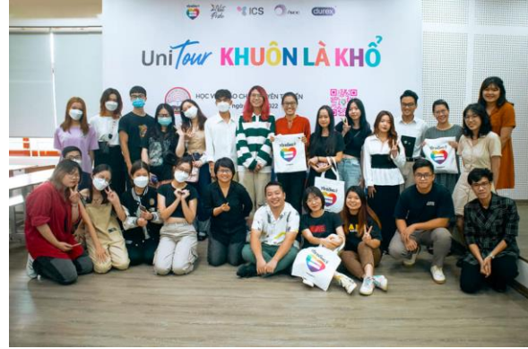
2022 Tôi đồng ý – UNI Tour Học viện Báo chí