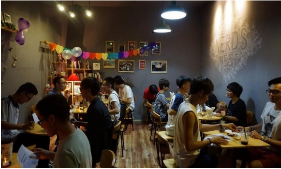
Buổi hẹn hò “Speed Dating” dành cho người trong cộng đồng LGBTQ+ tại The Nerd's Nest năm 2016

hò giấu mặt “Blind date: Cánh cửa yêu thương” (Jam Coffee, 2015), dạ hội dành cho LGBTQ+ “Inqueerable Night” (O’Learys Bar, 2018), đêm nhạc “Trans Dot: Chấm sao đêm” (The HUT Lakeside Bar, 2022), hay biểu diễn drag “Gagapalooza” (Sidewalk Hanoi, 2019). Ngoài ra, các nhóm cộng đồng cũng thường xuyên chọn quán cà phê làm địa điểm cho các buổi giao lưu, chia sẻ định kỳ theo chủ đề.