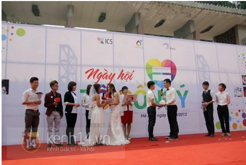
Ngày hội Tôi đồng ý tại Công viên Thống Nhất năm 2013.

“Tôi Đồng Ý 2013 không phải sự kiện đầu tiên về LGBTIQ mà mình tham gia, nhưng lại là một trong những kỷ niệm đáng nhớ nhất với mình. Ở thời điểm đó, mình thực sự cảm thấy thấu hiểu với thông điệp của “Tôi Đồng Ý” - hướng đến công nhận và hợp pháp hóa hôn nhân đa dạng. Mình có những người bạn trong cộng đồng đã ở trong một mối quan hệ nghiêm túc nhiều năm, song chưa thể về chung một nhà vì chưa được hợp pháp hóa. Mình tham gia với tâm thế của một ally và coi đây là dịp để tiếp xúc với nhiều người giống mình. Cũng qua sự kiện này, mình đã kết bạn với một người Mỹ để chia sẻ và tìm hiểu về những điểm giống và khác nhau trong văn hóa queer ở 2 quốc gia”. Chia sẻ bởi Trâm Anh qua Jotform.