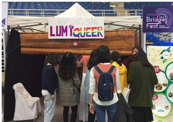
BridgeFest năm 2019 tại Cung Thể thao Quận Ngựa