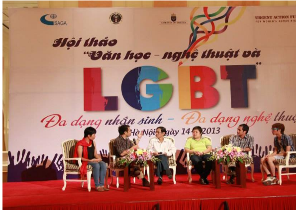
Hội thảo “Văn học – Nghệ thuật và LGBT” được tổ chức để kết nối những người làm nghệ thuật và người queer tại Khách sạn Daewoo năm 2013.

Bên cạnh đó, phòng họp, phòng hội nghị của các cơ sở kinh doanh dịch vụ lưu trú lại là địa điểm diễn ra nhiều hội thảo, tọa đàm, triển lãm liên quan đến LGBTIQ+ ở quy mô vừa và lớn. Các sự kiện này thường có sự tham gia của nhiều bên như cơ quan nhà nước, cơ quan đại diện ngoại giao, NGO, các cá nhân, tổ chức và nhóm cộng đồng. Điển hình như hội thảo “Văn học – Nghệ thuật và LGBT” (Khách sạn Daewoo, 2013), talkshow “Định kiến đến từ đâu” (Khách sạn Sao Mai, 2017), hội thảo “Chia sẻ về SOGIESC và UNCRC” (Nhà khách Bộ Quốc phòng, 2018), hay hội thảo “Chống bạo lực và phân biệt đối xử dựa trên xu hướng tính dục và bản dạng giới: Kinh nghiệm quốc tế và Việt Nam” (Khách sạn Intercontinental, 2022).