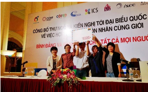
Hội thảo “Công bố Thư ngỏ và Kiến nghị tới đại biểu quốc hội về hợp pháp hóa hôn nhân cùng giới tại Khách sạn Daewoo, năm 2013 (ảnh: 6+).