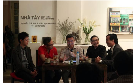
"Đúng hay Sai-Hôn nhân đồng giới" tại Manzi Art Space năm 2013