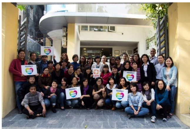
CARE tại Việt Nam hưởng ứng chiến dịch Tôi đồng ý năm 2013.

Giai đoạn năm 2012 – 2015, các sự kiện gần như chỉ tập trung truyền thông giảm định kiến kì thị trong xã hội và hưởng ứng chiến dịch Tôi đồng ý – I do – một chiến dịch truyền thông nhằm kêu gọi sự ủng hộ về hôn nhân đồng giới tại Việt Nam. Điển hình như Care chia sẻ trên Facebook Tôi đồng ý năm 2013: “Tất cả nhân viên, cán bộ của tổ chức CARE tại Việt Nam đã Tôi Đồng Ý! We do. We support. We act. We care”