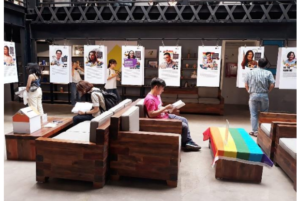
Triển lãm “Việt Nam Queer History Month” tại Savage Lounge năm 2017 (ảnh: Hà Nội Queer).