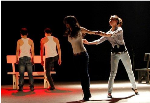
Vở diễn "Stereo woman - Được là chính mình" tại Nhà hát Tuổi trẻ Việt Nam năm 2012

nghệ thuật và talkshow (chiếm 61.29%), (2) giải trí như chiếu phim, hội chợ queer (chiếm 25.81%), (3) xây dựng cộng đồng (chiếm 6.45%) và (4) sức khỏe, sức khỏe tâm trí cho cộng đồng LGBTIQ+ chiếm 6.45%).