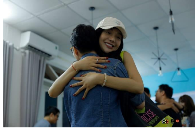
Workshop “Bước vào trong mình” hướng đến chia sẻ và chữa lành những tổn thương tâm lý cho người chuyển giới tại Moonwork CoWorking Space, năm 2018 (ảnh: 6+)