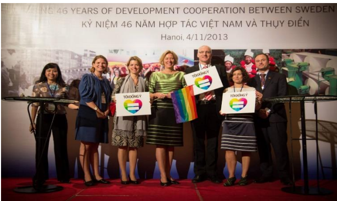
Đại diện Cơ quan Hợp tác Quốc tế Thụy Điển và cán bộ Đại sứ quán Thụy Điển ủng hộ hôn nhân bình đẳng ở Việt Nam năm 2013.

Đối với mục đích truyền thông, nâng cao nhận thức và giảm định kiến/kỳ thị xã hội, những sự kiện này thường do cơ quan đại diện ngoại giao phối hợp với các NGO, tổ chức và nhóm cộng đồng thực hiện dưới nhiều hình thức: tọa đàm, hội thảo, liên hoan phim, hưởng ứng các chiến dịch cộng đồng và Tháng Tự hào, gặp mặt các tổ chức và nhóm cộng đồng LGBTIQ+... Điển hình như sự tham gia của các đại diện từ Cơ quan Hợp tác Quốc tế Thụy Điển, Đại sứ quán Thụy Điển, Đại sứ quán Anh vào chiến dịch ủng hộ quyền hôn nhân bình đẳng “Tôi Đồng Ý” (2013, 2014) của Viện ISEE và Trung tâm ICS. Ngoài ra, vào ngày Quốc tế chống kỳ thị, phân biệt đối xử với người đồng tính, song tính, dị tính và chuyển giới IDAHOBIT (17/5) và Tháng Tự hào hàng năm, đại sứ quán của nhiều quốc gia như Mỹ, Anh, Ireland, hay Australia đều treo cờ lục sắc nhằm hưởng ứng tinh thần tôn trọng sự đa dạng và thể hiện sự ủng hộ công khai với cộng đồng LGBTIQ+.