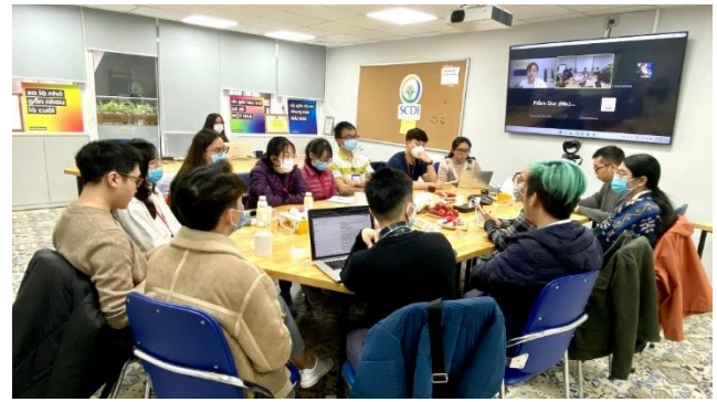
Buổi gặp mặt giữa các bác sĩ nội trú và cộng đồng LGBT tại Trung tâm hỗ trợ sáng kiến phát triển cộng đồng SCDI năm 2022