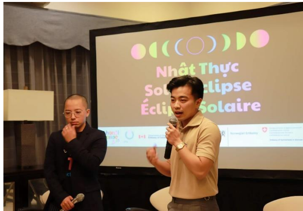
Buổi chia sẻ “Nhật thực” được tổ chức tại nhà riêng của Đại sứ Canada năm 2023.