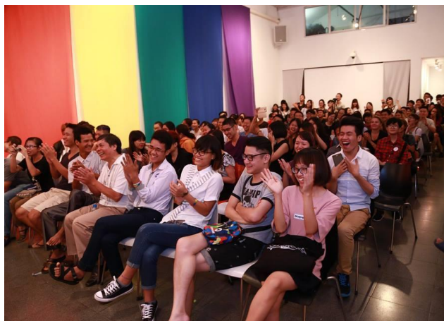
Sự kiện “Kịch tương tác với LGBTQ” được tổ chức tại Viện Goethe năm 2016.