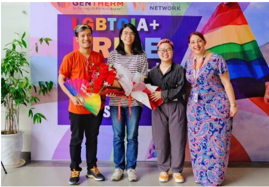
Hà Nội Queer và IT'S T TIME trong buổi chia sẻ về LGBTIQ+ tại Công ty TNHH Gentherm Việt Nam năm 2022.

Theo khảo sát, có 12 địa điểm thuộc không gian nơi làm việc có sự xuất hiện của cộng đồng LGBTIQ+ chiếm 2.73% tổng số sự kiện. Giai đoạn 2012 – 2015 có 4/12 sự kiện được tổ chức tại không gian trên nhằm hưởng ứng chiến dịch Tôi đồng ý – I do. Giai đoạn 2016 – nay, có 8/12 sự kiện diễn ra tại nơi làm việc và các sự kiện hướng đến đa dạng chủ đề hơn thông qua đa dạng cách tiếp cận.