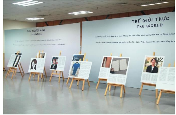
Triển lãm Hai Thế giới tại ĐH Kinh tế quốc dân năm 2023