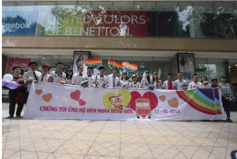
Đám cưới tập thể “Yêu là cưới” tại Tòa nhà Vincom năm 2013.

Các sự kiện đa dạng về cách thức từ triển lãm, đám cưới tập thể, đạp xe diễu hành... đã thu hút sự quan tâm và tham gia của nhiều người, nâng cao nhận thức của họ về các vấn đề LGBTIQ+.