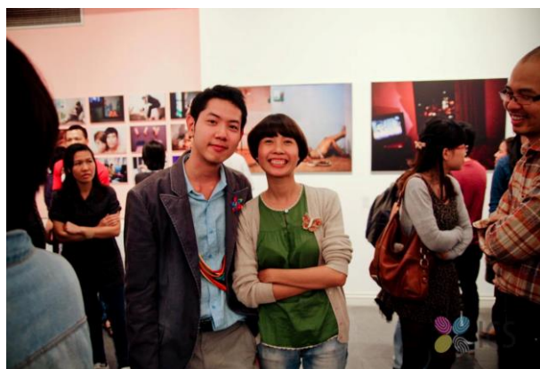
Triển lãm ảnh “Pink Choice” của nhiếp ảnh gia Maika Elan tại Viện Goethe năm 2013 (ảnh: ICS).

Đối với mục đích truyền thông, nâng cao năng lực và giảm định kiến trong xã hội, các sự kiện thường tổ chức dưới hình thức triển lãm, biểu diễn nghệ thuật, tọa đàm, hội thảo, và lễ hội. Viện Goethe là nơi diễn ra nhiều sự kiện nghệ thuật và tọa đàm về cuộc sống của người queer như: triển lãm “Pink Choice – Yêu là Yêu” của nhiếp ảnh gia Maika Elan (2013), triển lãm “Dưới ánh mặt trời” (2014), liên hoan nghệ thuật “Queer Forever!” (2015), hay tọa đàm “Con tôi đặc biệt” (2016).