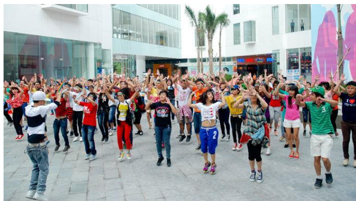
Hơn 100 bạn trẻ trình diễn màn nhảy tập thể mang tên Yêu là yêu tại Indochina Plaza, Cầu Giấy, Hà Nội

Trong 31 sự kiện tổ chức tại không gian công cộng, ngoài trời, 22.58% các sự kiện được tổ chức vào năm 2013. 2013 là năm diễn ra nhiều sự kiện LGBTIQ+ nhất tại các không gian này. Điểm nhấn của năm này là sự khởi đầu của Chiến dịch Tôi Đồng ý - một chiến dịch truyền thông xã hội được khởi xướng bởi Viện nghiên cứu Xã hội, Kinh tế và Môi trường (iSEE) và Trung tâm ICS nhằm kêu gọi sự ủng hộ của người Việt Nam với hôn nhân cùng giới. Ngày hội Tôi đồng ý tổ chức tại công viên Thống Nhất vào sáng 27/10/2013