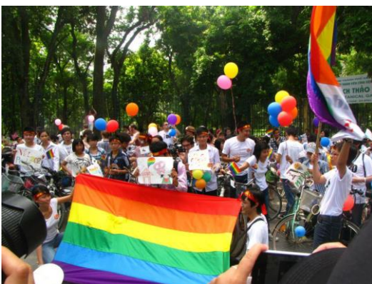
Viet Pride - Từ Stockholm đến Hà Nội: Pride không biên giới năm 2012

Các hoạt động diễn ra trong không gian ngoài trời thu hút được sự quan tâm của báo chí. Ví dụ Vnexpress (2012) đưa tin “Thuộc chuỗi hoạt động của ngày hội Viet Pride - phiên bản Việt của ngày hội Pride festival (tôn vinh sự đa dạng trong xu hướng tính dục, được tổ chức hằng năm ở nhiều nước), sáng nay hơn 200 người đã có mặt ở SVĐ Mỹ Đình để tham gia đạp xe ủng hộ người đồng tính. Trong số 200 người tham gia có khoảng một nửa là những người thuộc cộng đồng LGBT (người đồng tính, song tính và chuyển giới).” 7 Hay Tuổi Trẻ online (2012) cho biết “Hơn 100 bạn trẻ với trang phục trẻ trung, nhiều màu sắc đã mang đến những bước nhảy đầy ngẫu hứng trong gần 3 giờ. Trên nền nhạc Hair và Born this way, hai ca khúc nổi tiếng với giới LGBT của ca sĩ Lady Gaga, với thông điệp “Tôi chỉ muốn được là chính mình”. Màn trình diễn nhanh chóng thu hút đông đảo những vị khách xung quanh khu trung tâm, nhiều người khách nước ngoài hào hứng tham gia chương trình. Nhiều bạn trẻ đến từ các vùng lân cận như Quảng Ninh, Hải Phòng.” 8