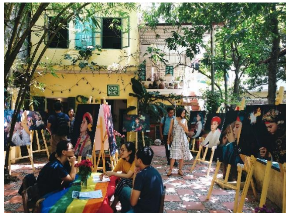
Triển lãm “Hầu đồng và Queer” tại Ố kìa Hà Nội năm 2019.